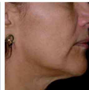
Après 2 semaines