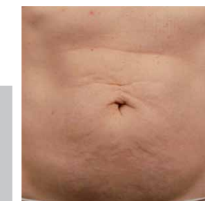
Après 6 mois