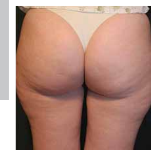
Après 6 mois