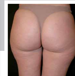
Après 14 mois